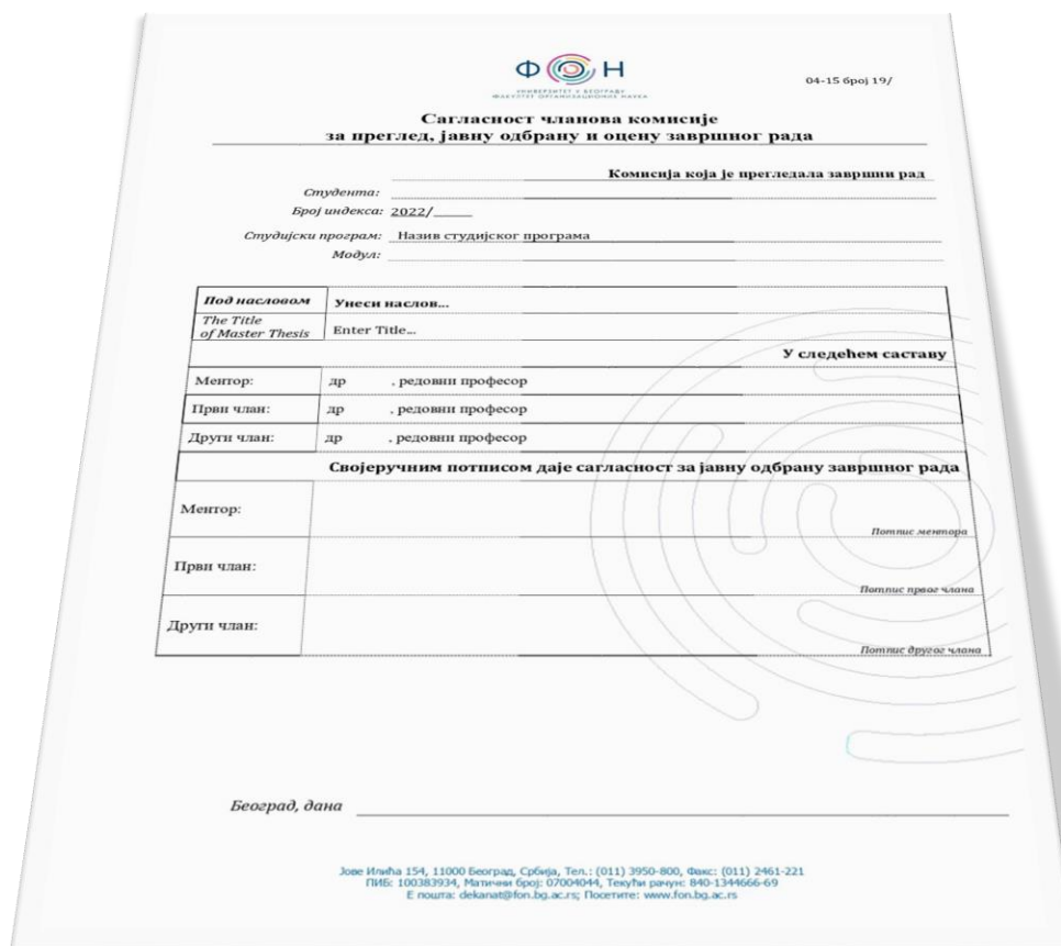
Слика 8. Образац сагласности чланова комисије за преглед, јавну одбрану и оцену завршног рада

у досије студента и представља трајну документацију. Образац се налази на сајту Факултета у делу Документа, Правилници, Обрасци и упутства.