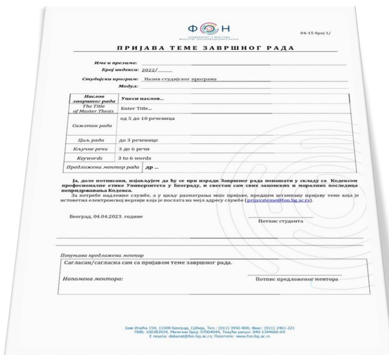
Слика 2. Образац Пријаве теме завршног рада