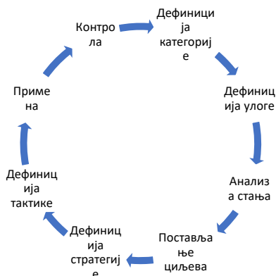
Слика 2. Пример слике прецртане у SmartArtu

Ниже на Слици 2 дат је пример прецртане слике у SmartArtu , Word-у , као могућа опција приказа.